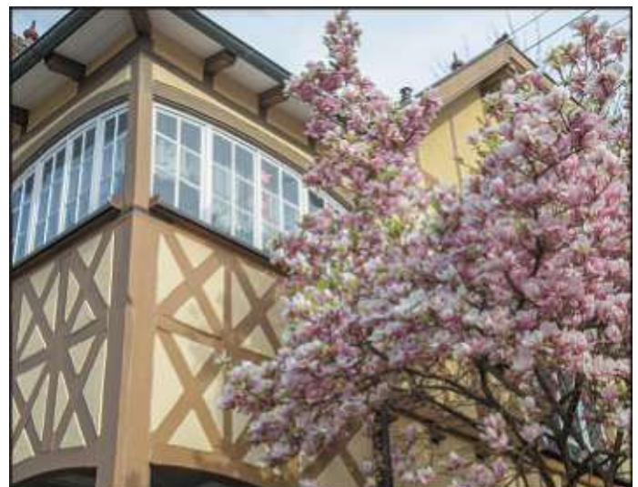
Fachwerk und Magnolien in Oßweil.